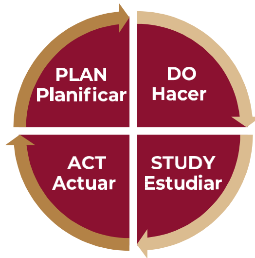
Ciclo PDSA para la mejora de procesos

Diagrama adaptado del Modelo de William Edwards Deming, que representa los diferentes ciclos de mejora hasta lograr su estandarización y llevarlos a niveles maduros de innovación y referencia.