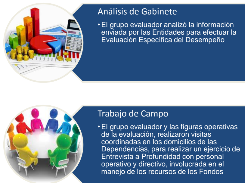
Figura 1. Evaluación de gabinete y de campo