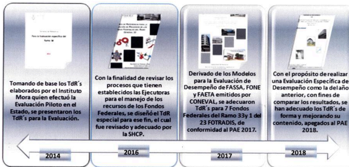
Figura 1.- Línea del tiempo de TdR's. Elaboración Propia.

En materia de Evaluación de Fondos Federales se ha contado con los siguientes TdR's derivados de los Programas Anuales de Evaluación 2014-2018: