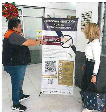
Imagen 1. Fotografías del Centro Integral de Servicios Estatal y Centro Integral de la Jurisdicción Sanitaria No. IV de Martínez de la Torre, respectivamente.