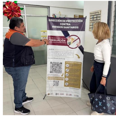
Imagen 1. Fotografías del Centro Integral de Servicios Estatal y Centro Integral de la Jurisdicción Sanitaria No. IV de Martínez de la Torre, respectivamente.

Del mismo modo, con el objetivo de maximizar el impacto social, se utilizan activamente las redes sociales y el micrositio dentro del portal oficial de la Secretaría de Salud y de Servicios de Salud de Veracruz. En este espacio, los usuarios pueden acceder no solo a información sobre la Estrategia Nacional de Buen Gobierno, sino también a diversas plataformas, programas y actividades de interés tanto para el sector regulado como para la sociedad civil.