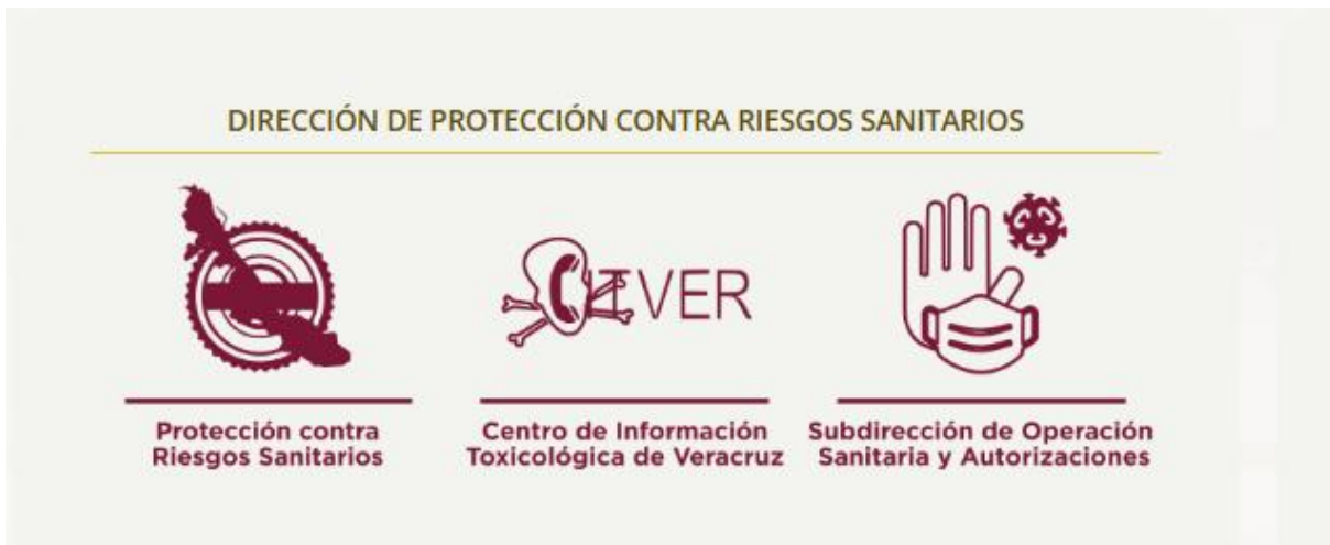
Imagen 2. Micrositio de la Dirección de Protección contra Riesgos Sanitarios.

https://www.ssaver.gob.mx/proteccioncontrariesgossanitarios/