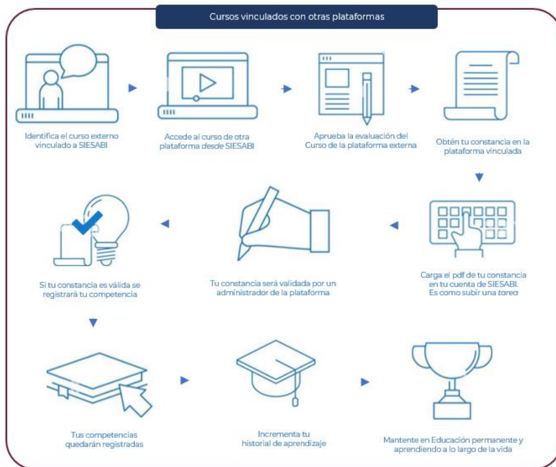
Figura 2. Proceso de validación de los cursos vinculados en SIESABI.