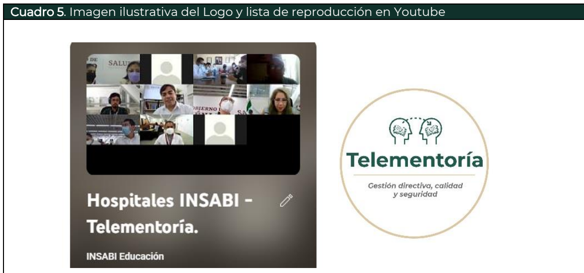
Cuadro 5. Imagen ilustrativa del Logo y lista de reproducción en Youtube

Las Telementorías son sesiones de acompañamiento a unidades hospitalarias sobre gestión directiva y de calidad. Con el objetivo de que la prestación de los servicios de salud se otorgue en un marco de calidad, seguridad y equidad en beneficio de la población sin seguridad social, es indispensable el fortalecimiento de las competencias directivas del personal de salud de todos los niveles de atención que les permita realizar un análisis efectivo para la toma de decisiones.