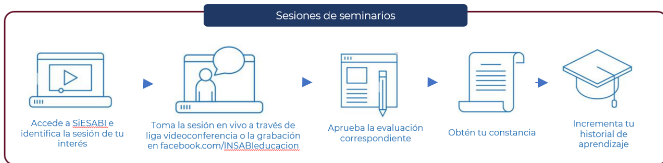
Figura 1. Proceso de educación continua de los Seminarios Permanentes

Se encuentra en desarrollo un Módulo que permitirá a los responsables de educación de los estados el seguimiento de capacitación por CLUES y por alumno.