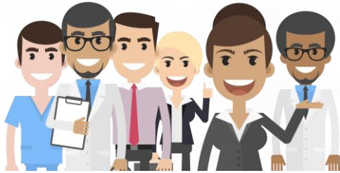
Unidad / Jurisdicción Sanitaria