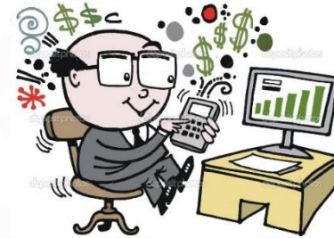
Subdirección de Enseñanza, Investigación y Capacitación