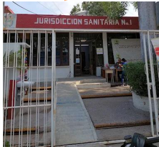
Jurisdicción Sanitaria / Unidad (Administración)